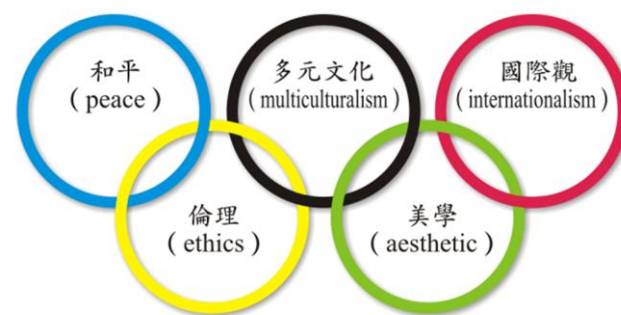
奧林匹克精神具有五個多面向目標

為推動奧林匹克教育，本校通識教育中心辦理全國有史以來第一次奧林匹克師資培訓營，兩天總計超過115位校內外老師及學生參與。本次研習相當精彩，讓我們看見這幾位先進，從運動員到頂尖學者，是需要多大的意志和不斷地努力！在場的每位種子教師彼此互動分享外，更透過正面激勵的對話，激盪出奧林匹克永不放棄的精神，亦學習「翻轉教室」的概念，試著將「奧林匹克精神」融入課程之中，每位種子教師收穫滿滿。