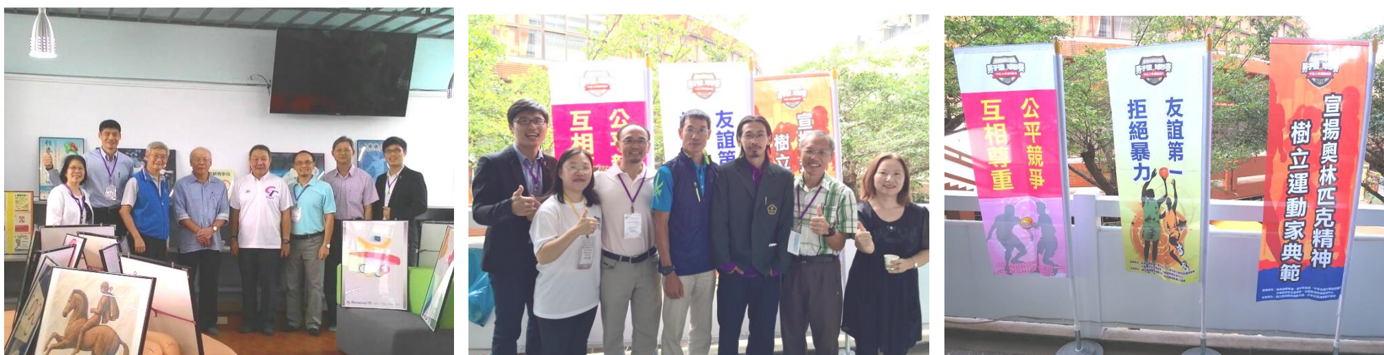
▲上圖為辦理「翻轉通識-解讀奧林匹克精神師資培訓營」相關活動照片。