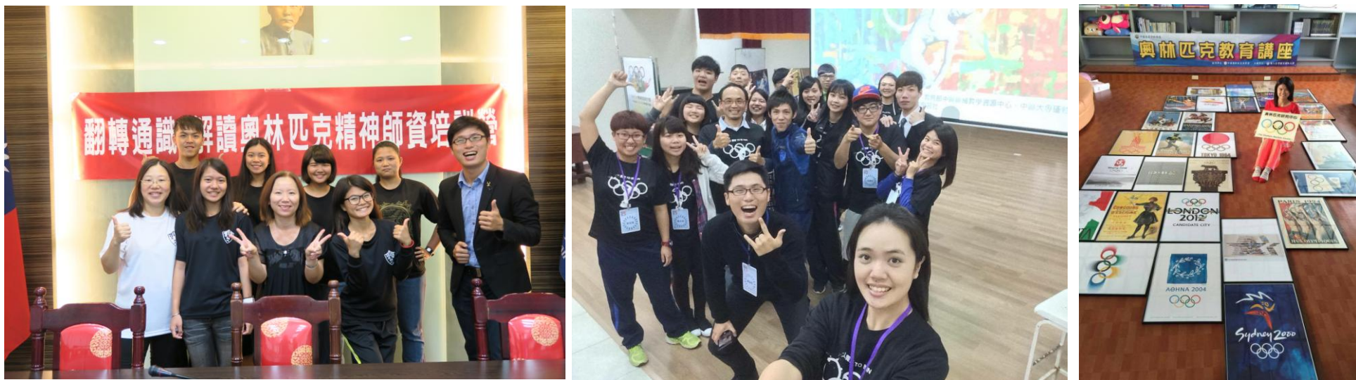
▲上圖為奧林匹克教育學習社協助推動「翻轉通識-解讀奧林匹克精神師資培訓營」、「2016 奧林匹克冬令營」、「奧林匹克海報文物圖書展」等活動！

我需要學習的事情有很多，告訴自己雖然現在的「職稱」是社長，但要做得「稱職」才最重要！每接觸完一個活動，我的腦子裡總是出現很多的想法。有些想法對於現在的我來說，要去履行它，還是有一點難度；但有些想法卻是巴不得自己趕快去實踐，並且讓更多人參與其中。感恩每一次在心裡的吶喊，總是有人願意助我一臂之力。我願意堅持信念，然後一同與社員創造好多不一樣的奧林匹克回憶！