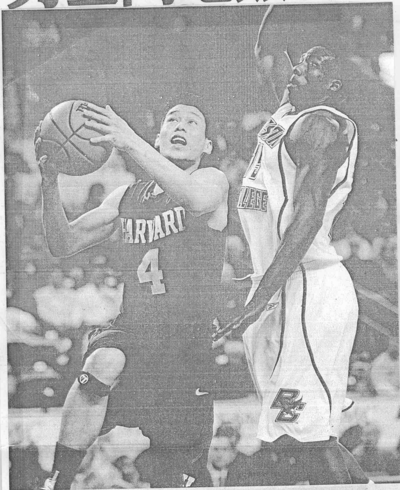
▲哈佛大學畢業的華裔好手林書豪（左），可望接受金州勇士隊的合約挑戰NBA。