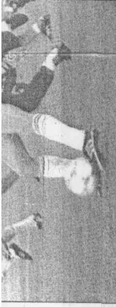
↑蘇聯前鋒阿連尼柯夫(前)，18日對喀麥隆隊中場球員普洛塔索夫(左)及喀麥隆球員塔塔烏(右)均在注視。

阿爾斯壯認為，市區內黑人小孩通常的出路是往娛樂界或體壇發展，而電視上轉播的大多是美式足球、棒球、籃球，黑人小孩不認識足球，而前往黑人市區推廣足球的都是白人，對黑人小孩難有說服力；他認為與班克斯聯手深入內城黑人社區，效果會更好。