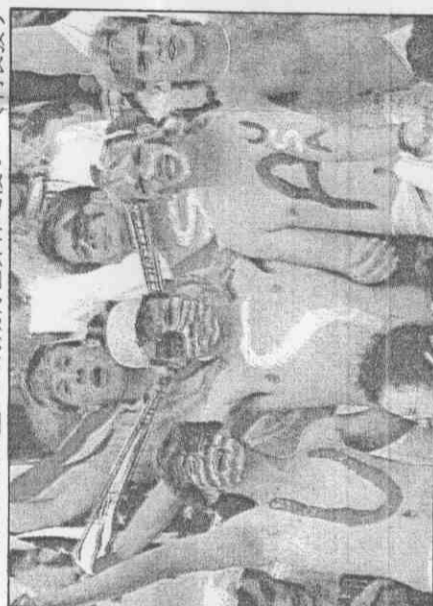
↑表現狂熱，美國球迷永遠不落人後。

不過，達沙耶夫在第1場對羅馬尼亞失守第1球後，已失掉教練對他的把關信心，後2場由副門將烏瓦洛夫取代他。「破百」的願望，只有期待世界杯之後了。(阿長發)