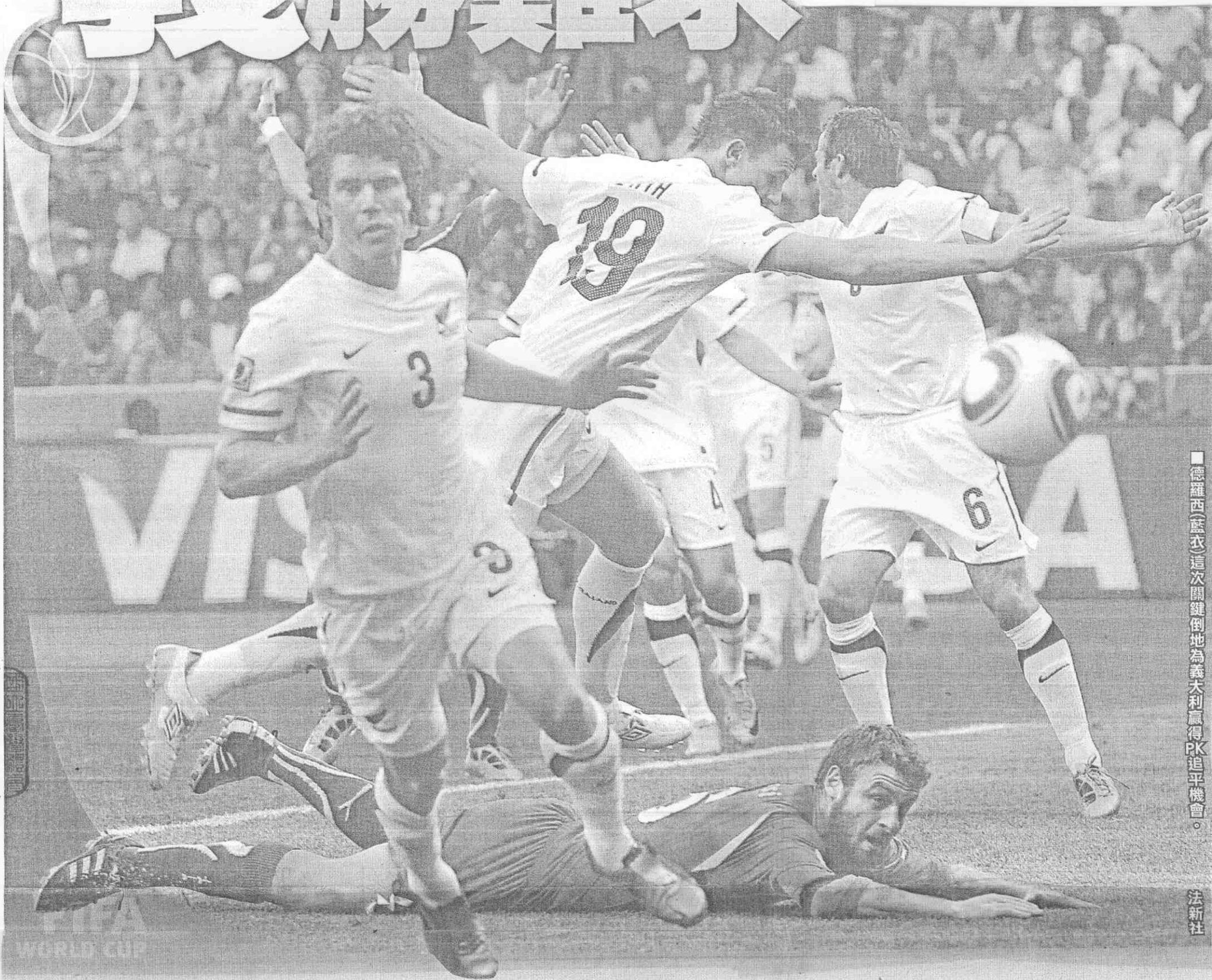
德羅西(藍衣)這次關鍵倒地為義大利贏得PK追平機會。