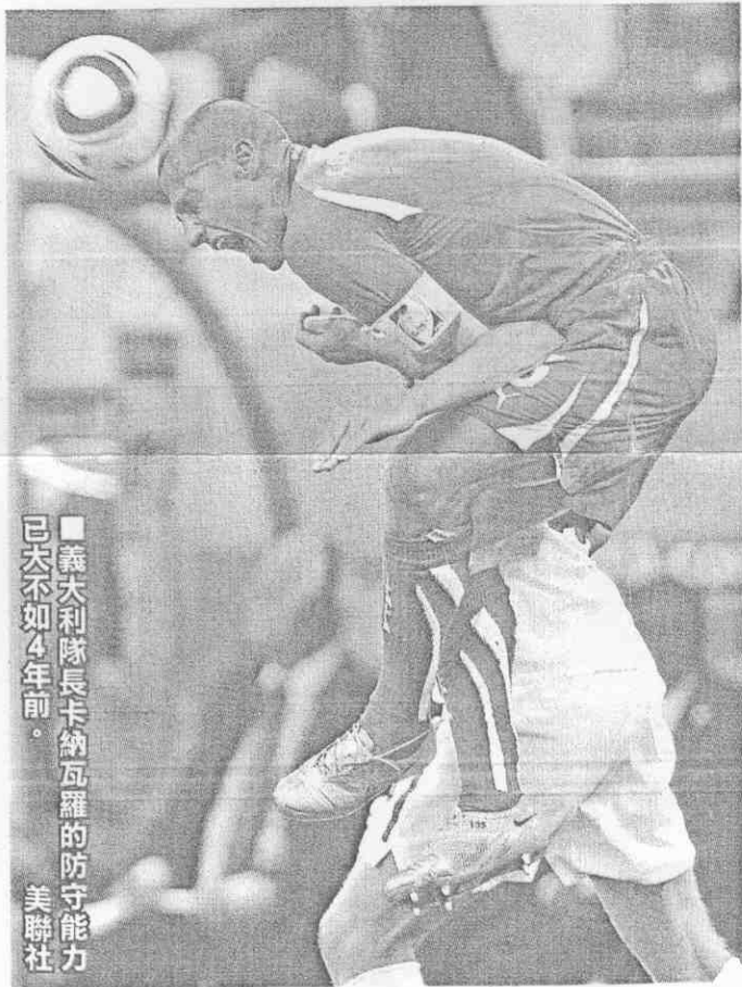
義大利隊長卡納瓦羅的防守能力已大不如4年前。

卡納瓦羅也很清楚職業生涯已接近終點，6月2日世足賽前，阿拉伯聯合大公國Al-Ahli球隊已宣布，世足賽後卡納瓦羅將離開歐洲戰場到中東養老，看來冠軍藍衫軍也將跟著老化的隊長慢慢走入歷史。