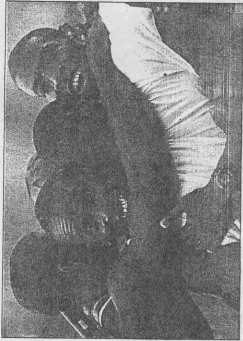
加拿大在四百接力打敗強敵美國後，四位選手高興地互擁慶祝。