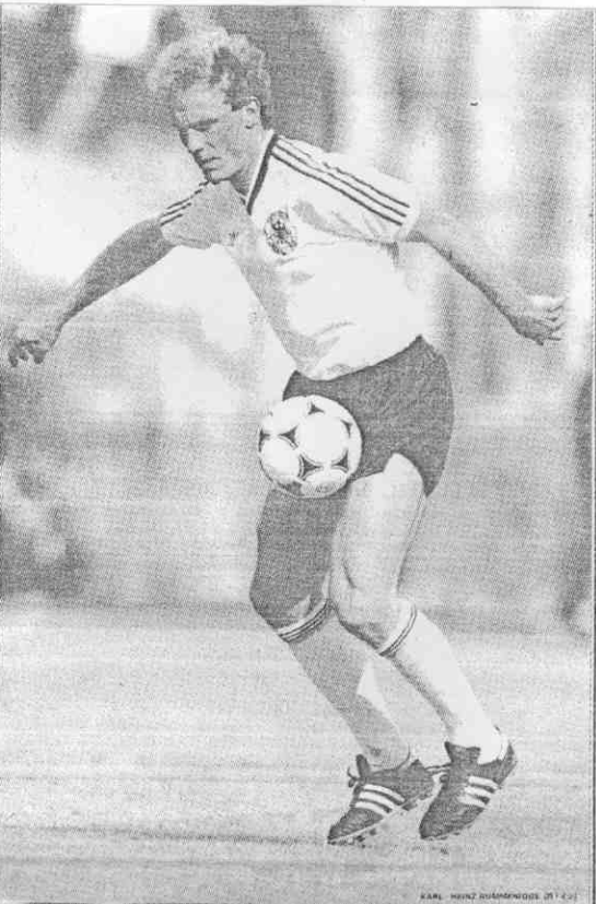
△西德隊隊長魯曼尼基曾當選歐洲足球先生，是天王巨星級好手。