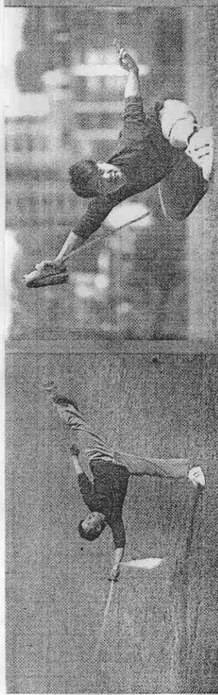
大陸武術教練在台灣