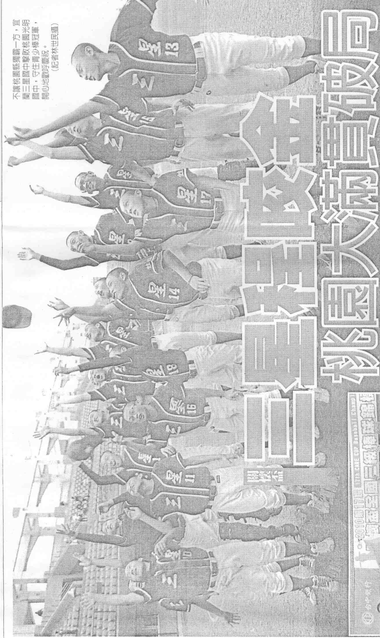
不讓桃園縣獨霸一方，宜蘭三星國中擊敗桃園光明國中，守住青少棒冠軍，開心地歡呼慶祝。