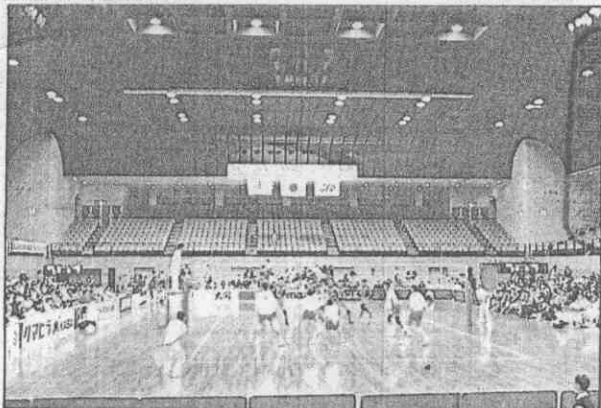
↓廣島太陽廣場運動體育館，是和平杯也是3年後亞運排球賽場地。 記者 蘇嘉祥／攝影