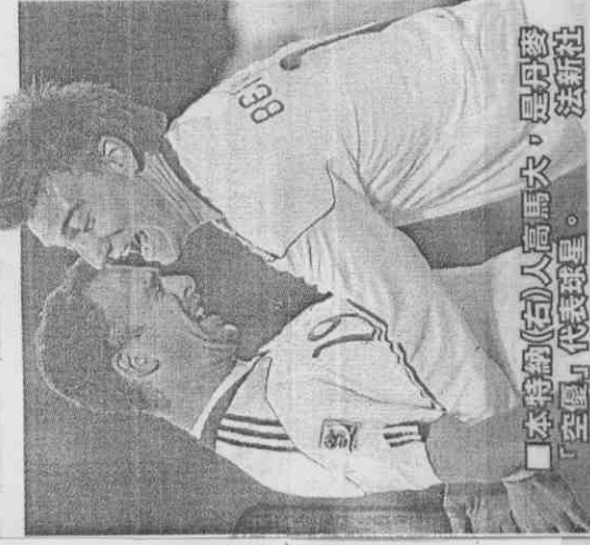
本特納(右)人高馬大，是丹麥「空襲」代表球星。

E組明天凌晨另1場荷蘭出戰喀麥隆，因為荷蘭已取得16強資格，勝負將無關晉級，預料荷蘭將在此役測試世足前2戰因傷缺賽的羅本(Arjen Robben)，看他復出的戰力可達幾成？並演練和他相關的戰術，希望從16強賽戰力更完整、堅強。