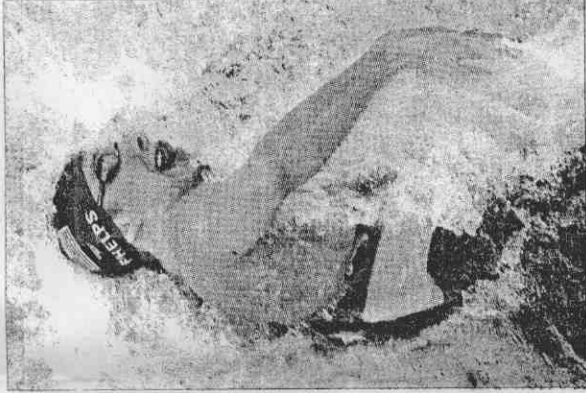
▲美國泳將菲爾普斯昨天再奪兩面金牌，個人生涯在奧運已取得11金，設下「菲氏障礙」。

菲爾普斯昨日先在200蝶刷新自己保有的1分52秒09世界紀錄，緊接著在休息1個小時後又再度登場，與隊友洛赫特、貝倫斯、范德爾卡伊合力在800自由式接力賽游出6分58秒56佳績，將世界紀錄往前推進3秒28，且足足領先銀牌得主俄羅斯隊有5.14秒差距，贏得相當輕鬆。