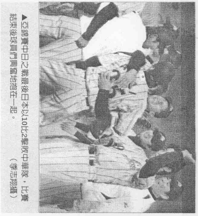
▲亞錦賽中日之戰最後日本以10比2擊敗中華隊，比賽結束後球員們興奮地抱在一起。

了個「日本殺手」的誰來打都沒敵，當時我真的太急了。」 所幸接下來他就開始仔細觀察，也發現達比修鋼的臉上不禁露出一有狀況不算太好，許多拿手變化球都投不進理想角度，所以接著專心選擇直球出棒。果然第一次，上場先物到四壞球保送，第六局等到一好三壞後狀況，並快速調整自，瞄準對方一顆直球打成中外野兩全壘打。 鋒仔本來就是國內最具威力的強打者，而隨著年齡增長，經驗累積越來越豐富，打法越見成熟，並且打成一壘上空沖。昨晚亞錦賽這一轟雖未能扳倒日本，明年的世界區資格賽中華隊更需要他的長程火力支援。 一顆內角快速球，任