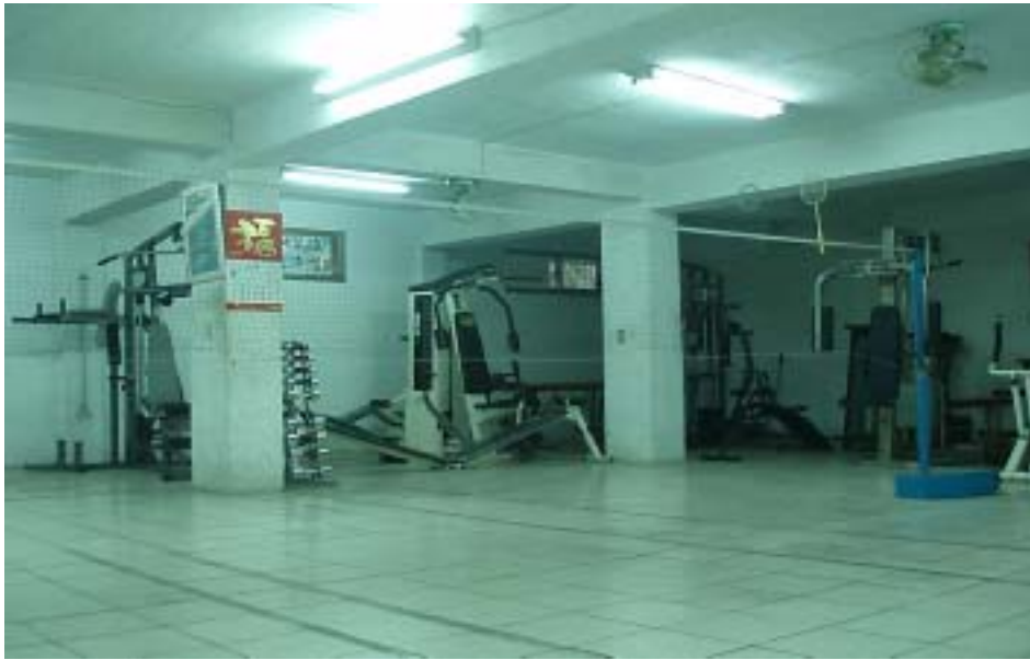
圖 1-1 改良式羽球之場地