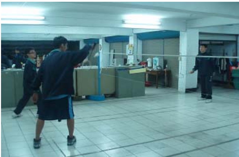
圖 1-2 改良式羽球對打實景（二打一）