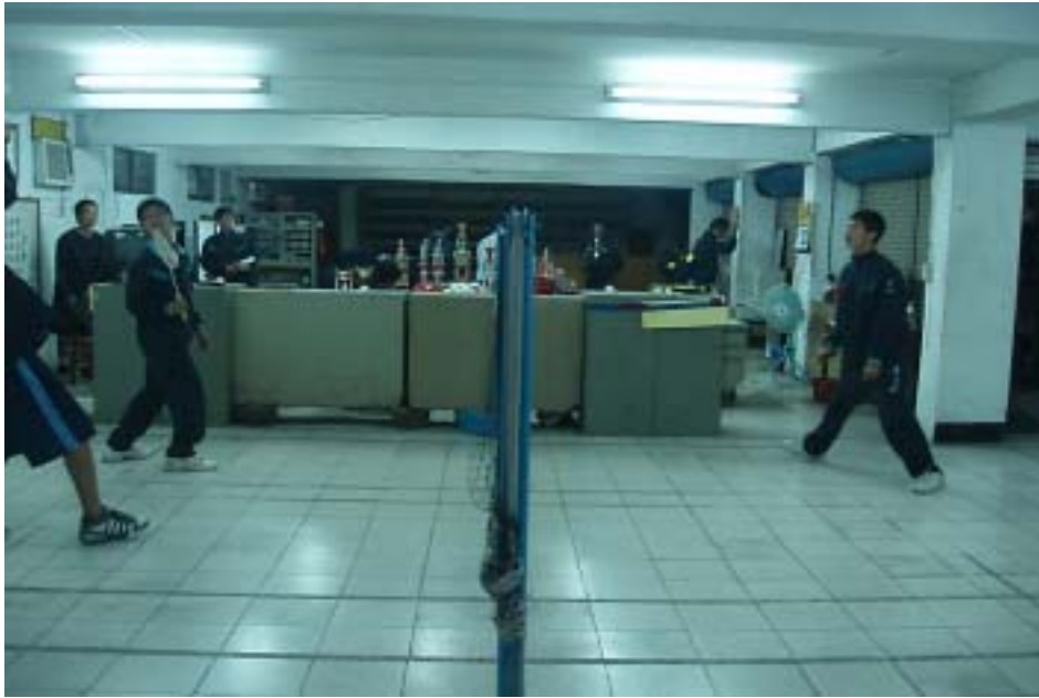
圖 1-3 改良式羽球對打實景（二打一）