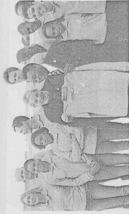
巴西總統魯拉(前排左四)與前足球名將比利(前排右三)都出馬為里約熱內盧爭取2016年奧運主辦權投票。(法新社)