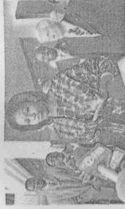
美國第一夫人蜜雪兒在飯店前接受媒體採訪，她表示一定會全力支持芝加哥申辦奧運。

馬德里曾申辦2012年奧運失利，這次捲土重來，獲得全國超過8成民意支持，但在籌備上並未記取前次教訓，相關企劃書不夠專業、場館分散，組織能力受到嚴重質疑。