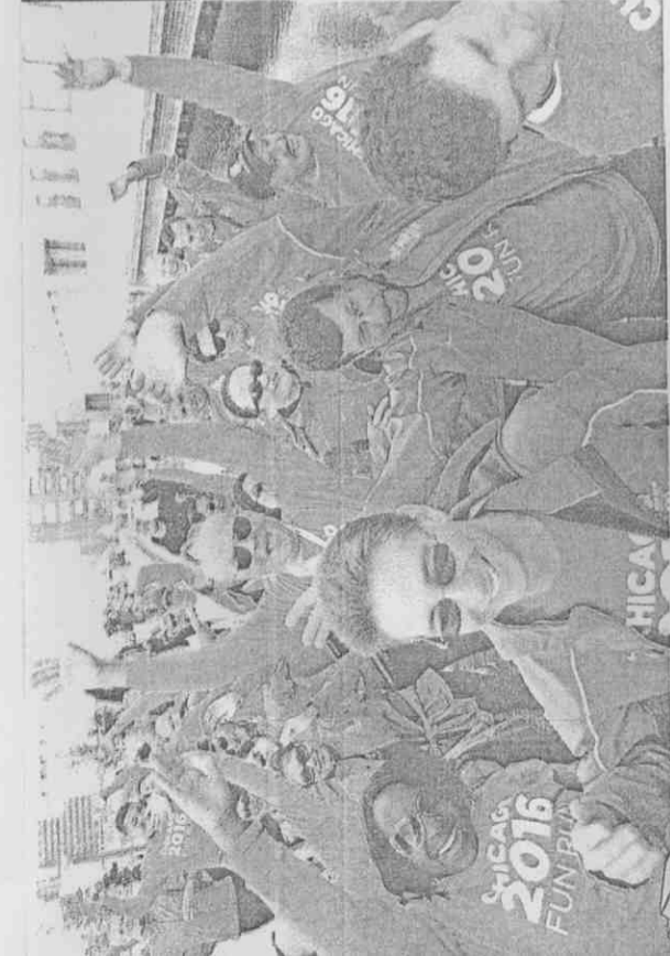
芝加哥的奧運支持群眾在奧運舉辦城市決選前夕辦了一場「快樂路跑」(fun run)活動，希望用熱情說服國際奧委會委員。 一群日本支持者支持東京申辦奧運的三角旗，以腳踏車遊行的方式為東京加持，希望能得到國際奧委會委員青睞。