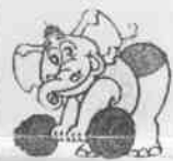
大陸孫天妮在亞運女子舉重第五級，以總合二四五公斤打破世界紀錄。