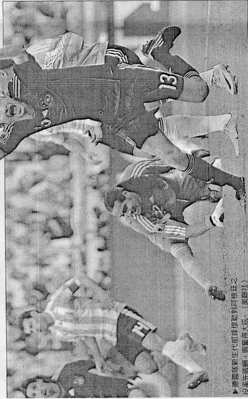
▶德國隊新生代前鋒穆勒對阿根廷之役率先破網，興奮得大叫。