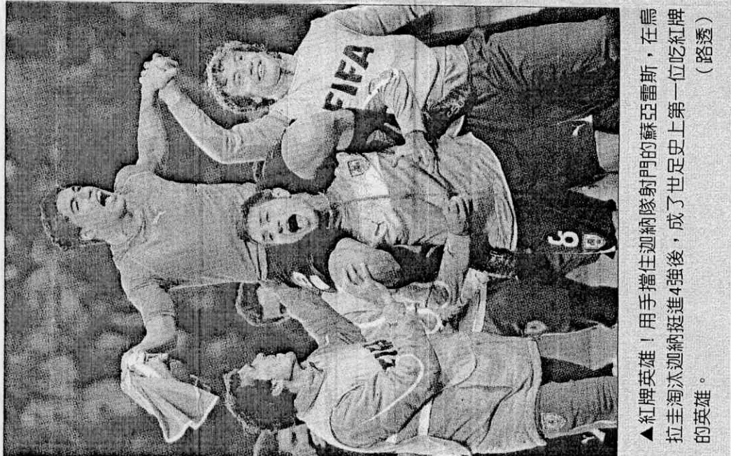
▲紅牌英雄！用手擋住迦納隊射門的蘇亞雷斯，在烏拉圭淘汰迦納挺進4強後，成了世足史上第一位吃紅牌的英雄。

▲我接！蘇亞雷斯 (左) 這個故意手球，讓烏拉圭在睽違40年後再度挺進世足4強，烏拉圭後衛富西萊 (右) 也壯烈成仁，只是慢了一步。