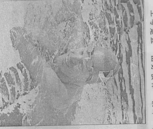
南非游泳派金在台北聽奧勇奪七金，他賽後習慣在台北聽繩上休息。