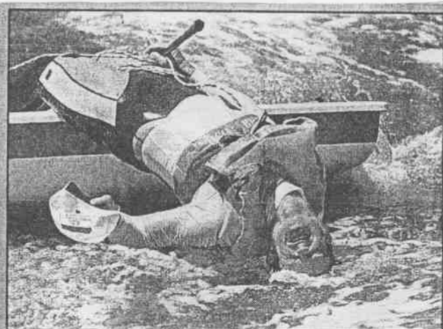
樂昏頭 挪威的划船選手莫柏格得到帆船雷射第三名，他把頭栽入水裡慶祝銅牌。