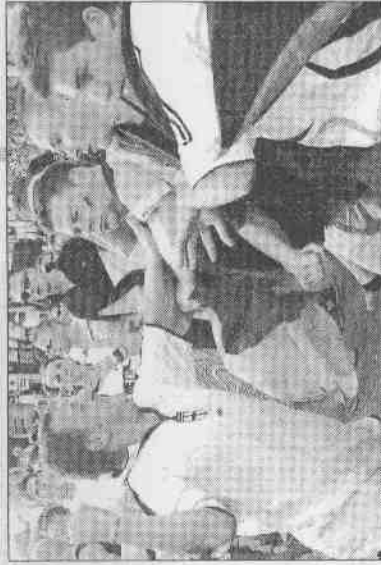
▼英格蘭和德國球迷，相互對峙，引爆發糾紛。

兩造球迷利用廣場上的塑膠桌椅、酒瓶、旗幟等物品為武器互相攻擊，廣場上隨處可見被砸毀的塑膠桌椅和酒瓶，還有球迷看到火。有日擊者看到一名臉部流血的德國人被帶離廣場，還有5人受傷。逮捕的滋事球迷，其中大多是英格蘭球迷。