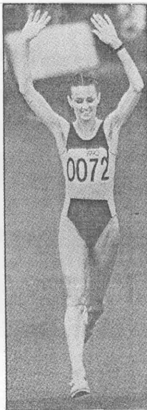
上左圖：澳洲選手馬丁31日以2小時25分28秒贏得女子馬拉松冠軍，並刷新大會最佳成績。