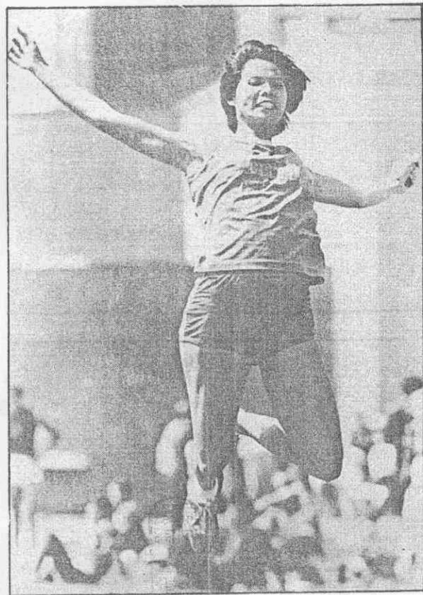
→紀政在5屆亞運獲跳遠金牌。