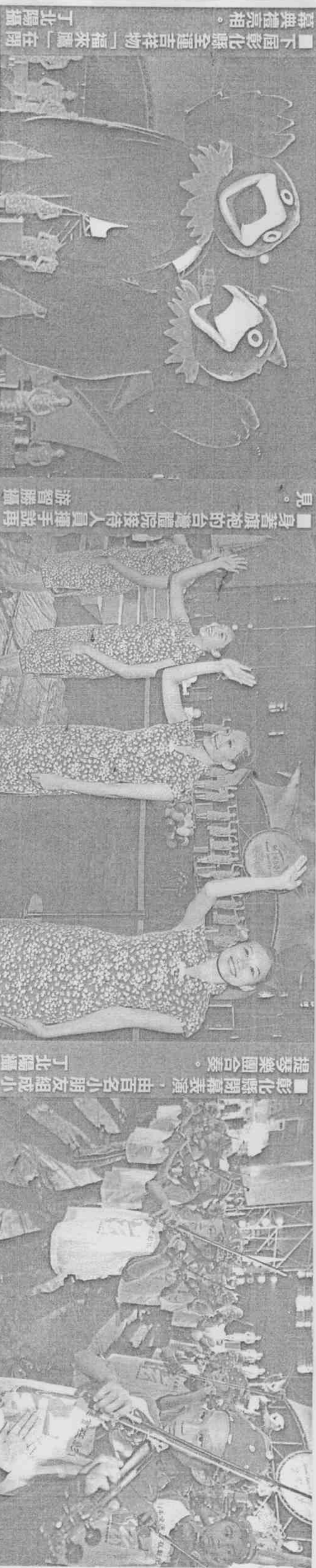
■下屆彰化縣全運吉祥物「福來鷹」在開幕典禮亮相。