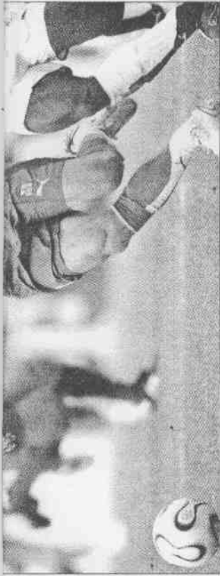
▲捷克隊球星內德維德(左)，今晚將是義大利隊嚴加看管的對象。