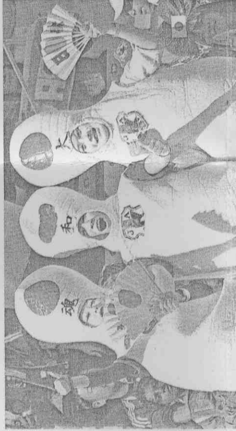
▲這是日本球迷傳統的加油方式,但今年有不少球迷也吹起嗚嗚讚啦助威。