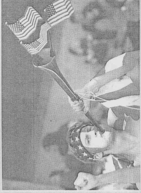
▲美國球迷的嗚嗚讚啦還結合國旗，吹起來更有氣勢。