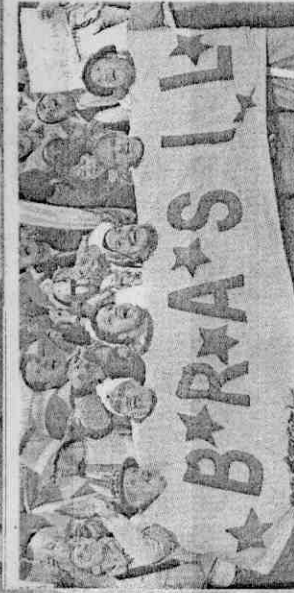
巴西以3:0擊敗智利，穿著連體賽衣的球迷們興奮地在場邊高歌，慶祝勝利。