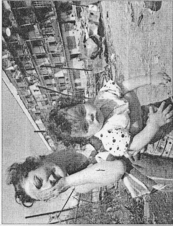
▲俄羅斯和喬治亞爆發軍事衝突，一名婦人抱著小孩哭泣（上圖）；但兩國選手在北京奧運卻仍保持君子之爭，右圖為女子10公尺空氣手槍奪得銀牌的俄國女將納坦莉（左），與拿下銅牌的喬治亞選手尼諾（右）一起相擁。（相關新聞刊A3）