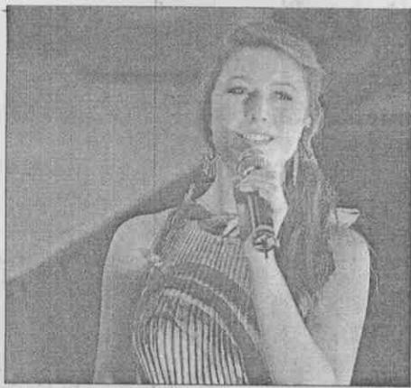
紐西蘭國寶級歌手海莉天籟般嗓音感動全場。