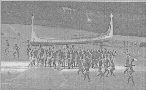
達悟族著名的「飛魚季」拼板舟下水儀式。

大海是生命之母，四面環海的寶島，依附在湛藍的海洋當中，顯得格外璀璨明亮，也象徵著大地的起始，是生命的禮讚。活動開始由數百位身穿藍色服飾的舞者揮動著水球翩然入場，象徵海洋之母的南台舞踏國寶李彩娥，在場中央翩然起舞，展現台灣自然之海的豐富與多樣，百蝶飛舞讓人驚嘆「福爾摩沙」，美麗的寶島。台灣早期的多元原住民文化，是寶島特有資產，舞者用布幔模擬出了水文後，緊接著遠傳族人手持著船槳在後，搖擺著一艘大型達悟族「拼板舟」入場，震耳欲聾的呼著口號，象徵達悟族著名的「飛魚季」拼板舟下水儀式。