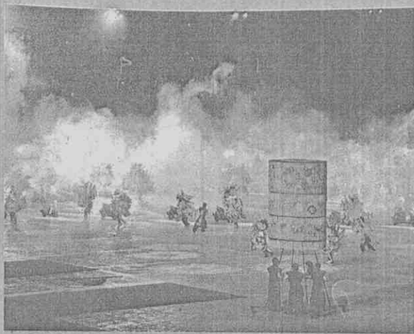
新潮的電音融合廟會神將與三太子，把台灣傳統與潮流交織後的文化放送至全世界。