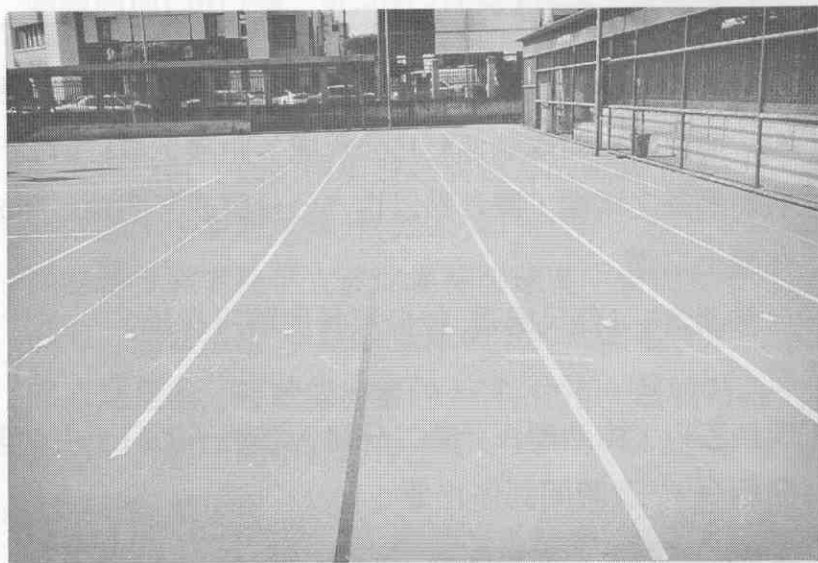
圖二：測驗場地規劃圖