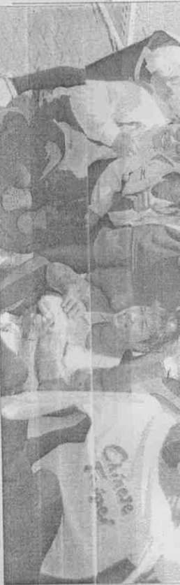
▲中華龍舟隊為台灣摘下世運會第一面獎牌，教練與選手興奮地在蓮池潭畔留影。