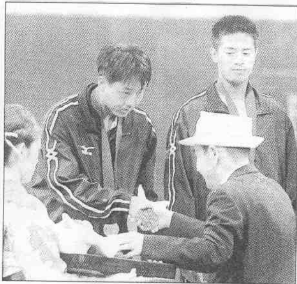
(上右)繪家劉、(二左)志安簡隊網軟子男華中↑ 真傳阪大/團訪採運亞東。牌銀頒獲