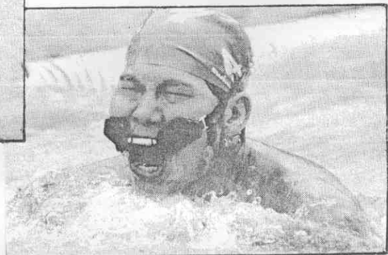
鏡蛙連，足十勁拚個個，手選老的賽泳齡分人成國全（攝復運郭）。會理不都了落鬆