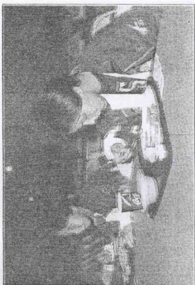
中華代表團旗幟在選手村內。