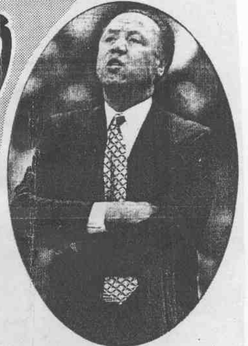
昨斯肯威·尼蘭練教隊鷹大蘭特亞↑ 勝千一」到達位一第上史NBA為成天 ·練教的「