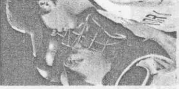
王建民出戰白襪，談話有助於穩定局面。洋基隊台灣投手王建民（右）五局略為不穩時，捕手波沙達上前與他溝通，也助建仔安定下來。