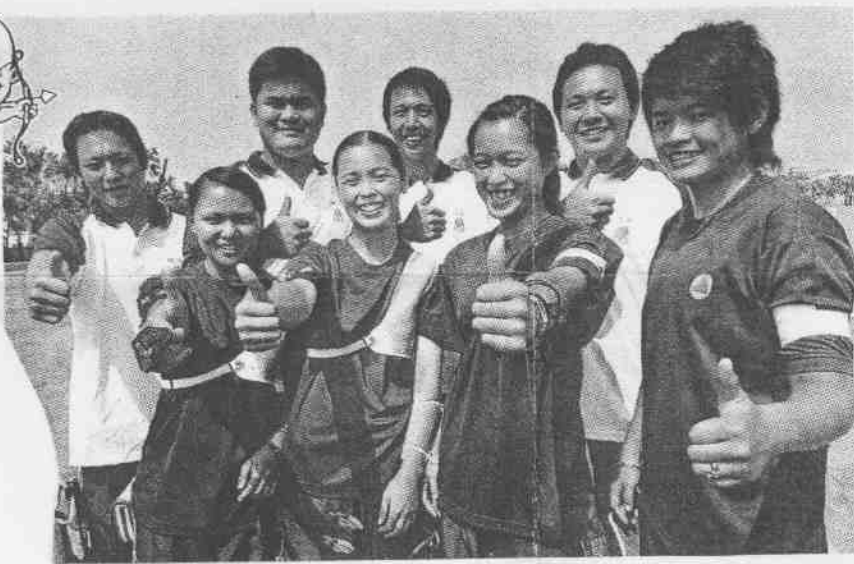
台南投縣包辦男女團體射箭金牌，選手們喜孜孜的豎起大拇指。