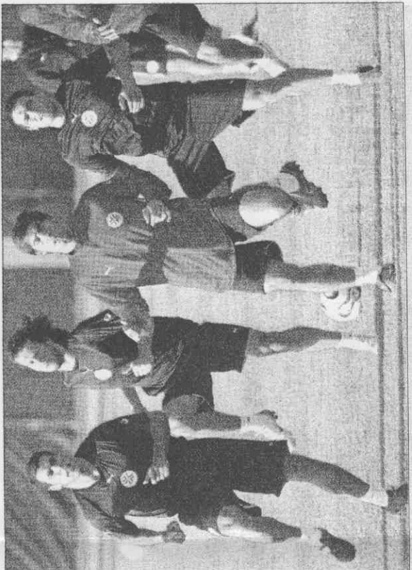
▲巴拉圭雖然在第一仗吃了敗仗，但在英格蘭之手，但晉級第二輪並未完全失去希望。

巴隊較為有利的是，主力前鋒都在德國踢球，在柏林球場出賽猶如在自家的主場踢球，此外，巴隊歷來和瑞典交手還沒輸過球，相對提升了爭取勝利的信心。