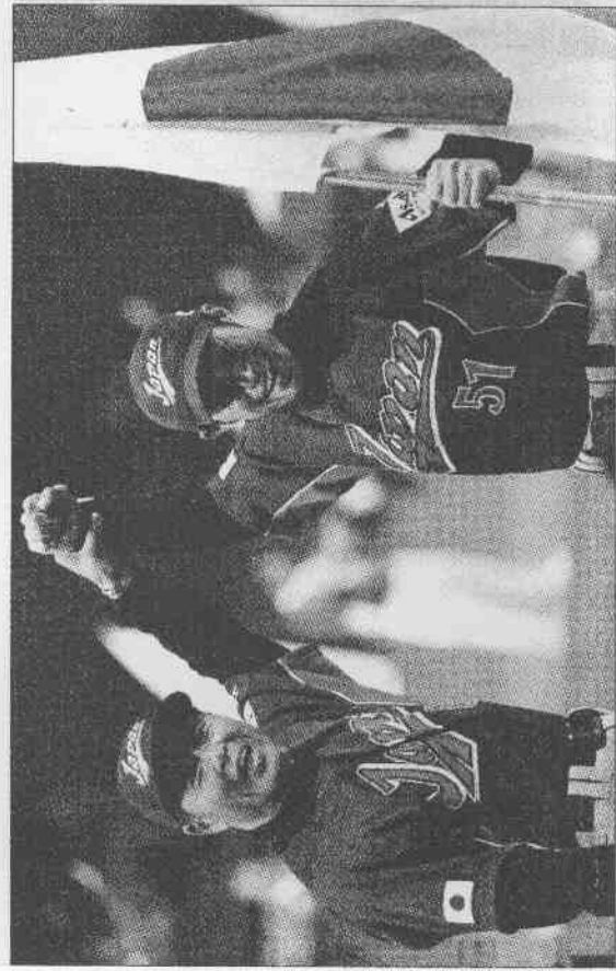
日本封王之路溫度起伏表

古巴總教練瓦雷茲稱讚：「日隊打擊火力很強。」這是古巴連續37場在國際賽晉決賽，此戰前的近5次都拿冠軍。