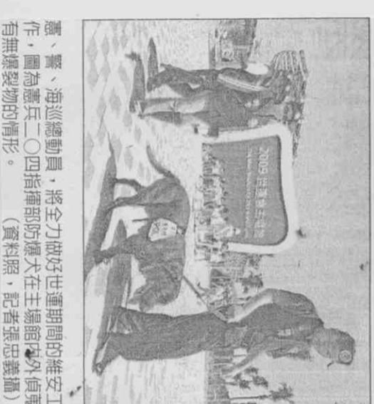
憲工、警、海巡總動員，將全力做好世運期間的維安工作，圖為憲兵二〇四指揮部防暴大在主场館內外偵蒐有無爆裂物情形。