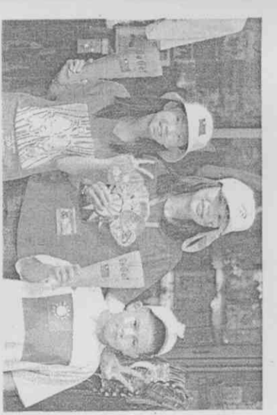
國旗上裝，展現台灣熱情

高雄世運會今日登場，備受矚目的獎牌亮相，獎牌融合海洋、原住民意象，還有代表台灣「蝴蝶王國」的圖騰，別具特色。 （中央社）