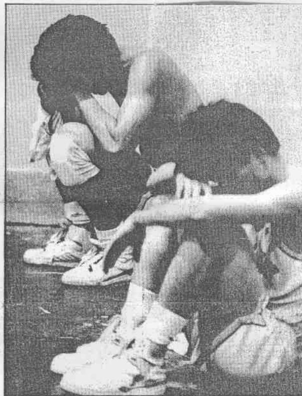
←冠軍飛了，南山哭了。

屏中贏了，球員們高興得把教練高高拋起。南山球員高亢的期待卻在最後一秒變生肚腹，大男孩們都哭了。