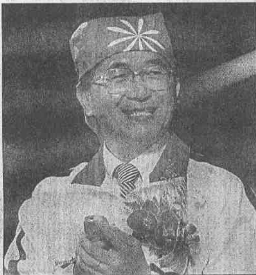
▲阿扁總統頭戴彩色頭巾打手機點聖火，是大運會開幕典禮的高潮。記者鍾豐榮／高雄傳真 記者鄭清煌／高雄報導

青年帶頭動，台灣有希望，總統戴頭巾喊口號，大運會揭開序幕，今起 10 種競賽全面開戰。