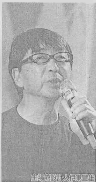
主場館設計人伊東豐雄