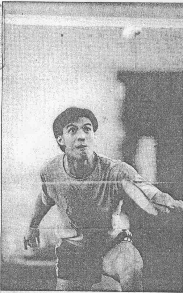
↑泰國的森普練得極勤，想在名人賽打出佳績。