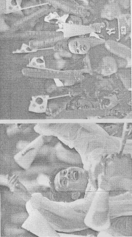
台韓冠軍賽兩方球迷相互互動，地主象迷興奮地高舉雙手慶祝八局的得分，但客队也有南韓球迷迷於場邊加油。

金星根認為，台灣球隊實力是個謎，他舉亞職大賽的例子，認為統一獅短時間內就「變了一支球隊」，強悍程度超乎想像，這次對象隊沒有做太多情報，僅靠比賽畫面來判斷，果然有誤差，昨天他幾乎都沒離開過房間，反覆地看象隊的錄影帶，就是希望能找出破解之道。（記者鄭又嘉）