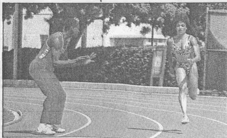
之休退她在，色角L手選一練教「的爾艾婿夫和絲菲瑞葛▲ (影攝運全用使家獨報本) 。

台灣運動風氣近年來頗為高漲，許多家長早已丟棄老觀念，甘願讓掌上明珠拋頭露面，練就一身陽剛之氣，與男子共同在競技場上展露丰華。