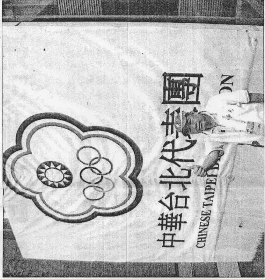
中華台北代表團 CHINESE TAIPEI