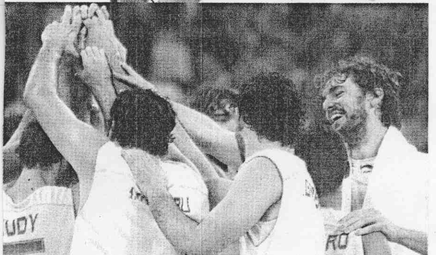
西班牙隊的加索（右一）與隊友一同慶賀擊敗8強對手克羅埃西亞，晉級4強賽。