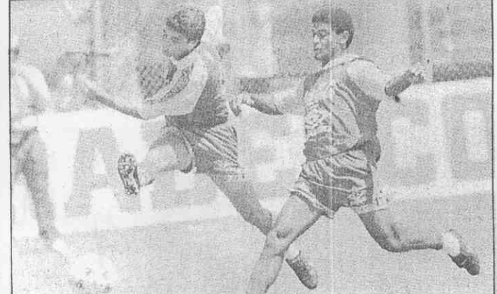
大賽前夕 巴西名將貝比多(左)在練球時，於隊友馬西諾糾纏下奮力起腳。巴西將於台北時間十日凌晨出戰荷蘭。