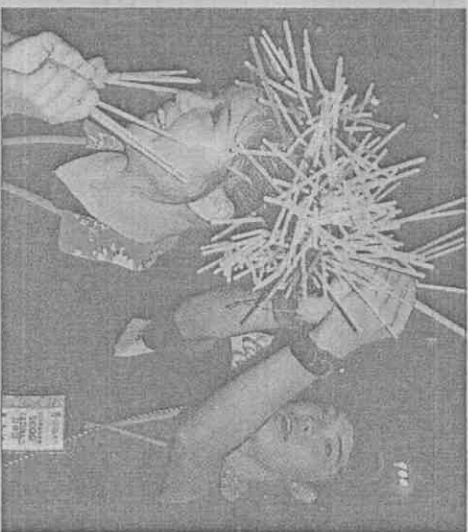
世運閉幕式現場提供螢光棒，民衆乾脆插在頭髮上搞怪。