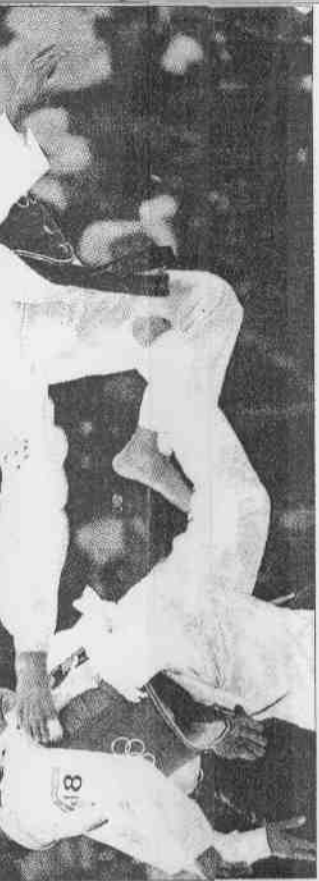
↑奧運金牌跆拳道選手朱木炎在多哈亞運測試賽，遠程目標挑戰北京奧運。