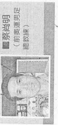
蔡尚明 (前奧運男足總教練)