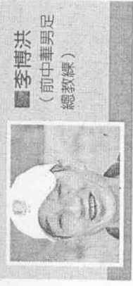
李博洪 (前中華男足總教練)

日本整體組織打法已在亞洲數一數二，我相信且盼望日本可以贏巴拉圭1球，應該很可能拚到延長賽，或是PK大戰才能分出勝負。